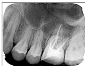
受講後の根管充填： このクオリティで根管充填