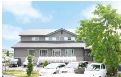
医療法人社団八龍会すずき歯科医院 〒437-0023 静岡県袋井市高尾 1780